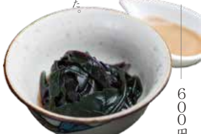
はんだま胡麻和え