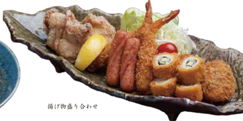
揚げ物盛り合わせ