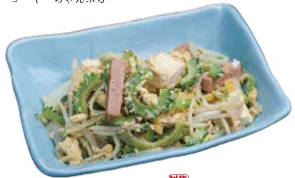
ゴーヤちゃんぷる