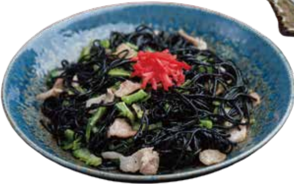
イカ墨ソーメンチャンプル