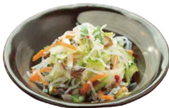
春雨のゴーヤ和え