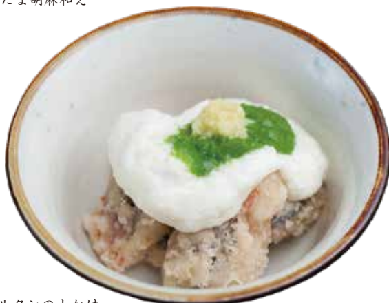
グルクンの山かけ