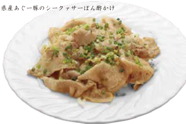
県産あぐー豚のシークアサーぽん酢かけ