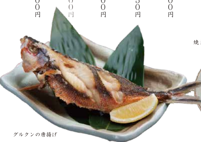
グルクンの唐揚げ