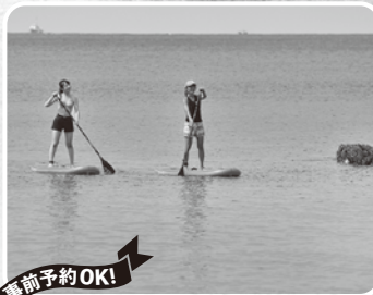
SUPクルージング体験