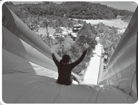
ビッグマウンテンスライダー