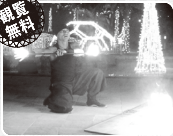
スペシャルパフォーマンス