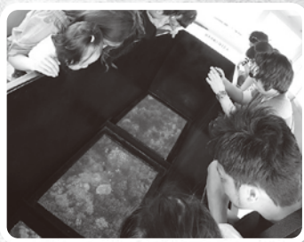
アオサングラスボート