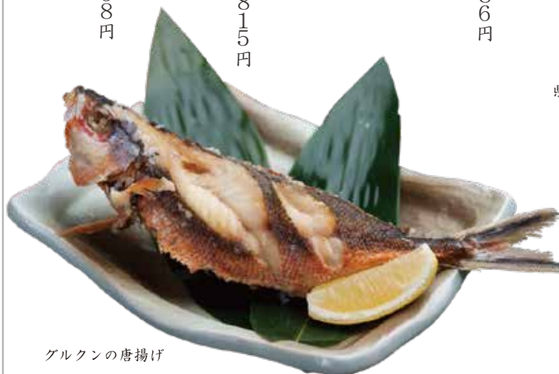
グルクンの唐揚げ