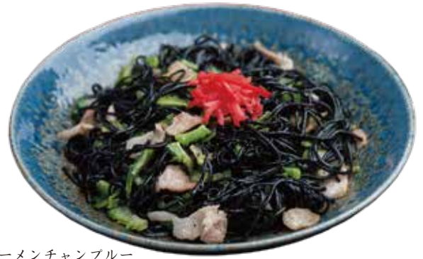
イカ墨ソーメンチャンプルー