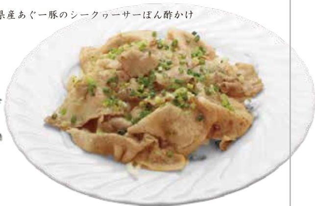
県産あぐー豚のシークワサーぼん酢かけ