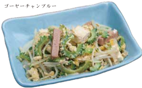
ゴーヤチャンプルー