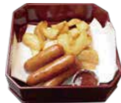
フライドポテト French fries ¥632