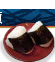
おにぎり Rice ball ¥253