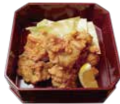
若鶏の唐揚げ Fried chicken ¥1,012