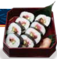
太巻き Thick rolled sushi ¥1,012