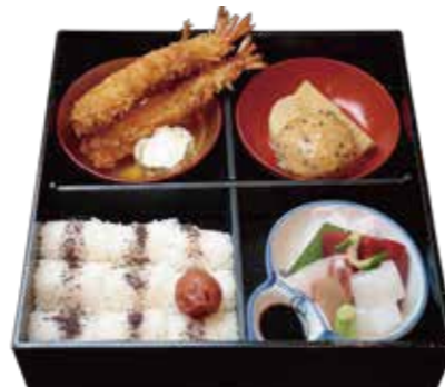
海老フライ弁当 Fried shrimp ¥2,530