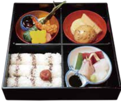
幕の内弁当 Various side dishes ¥2,530