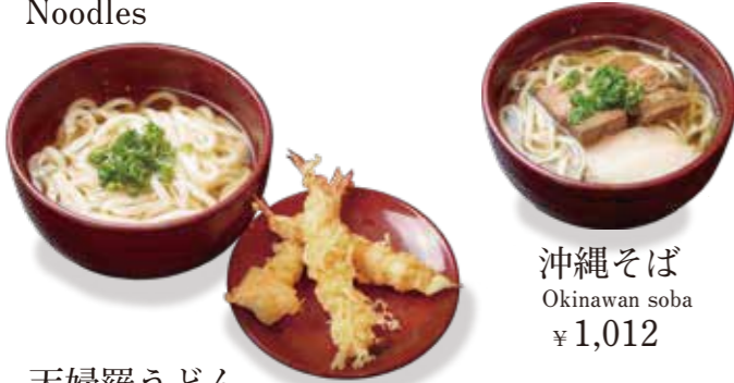
沖縄そば Okinawan soba ¥1,012