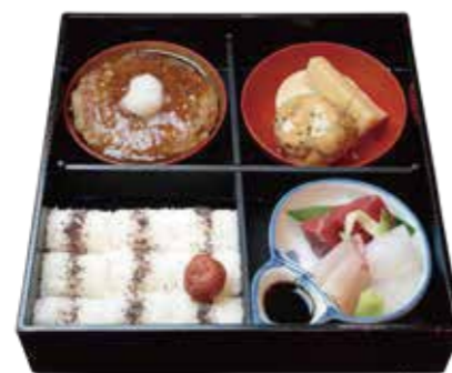
ハンバーグ弁当 Hamburg Steak ¥2,530